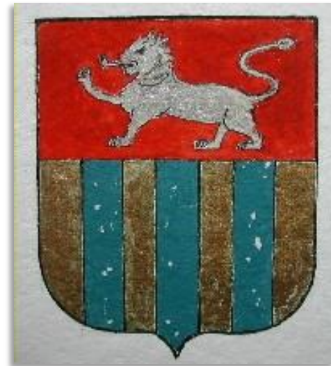
Wapenschild geslacht 'Van Tilburg'

Het verhaal begint bij Alain van Penthievre (ca 1100-1146), 1st Earl van Cornwall en Richmond, die trouwde met Bertha van Bretagne. Hij voerde een wapen van zilver met een schildhoofd van keel (rood). Breton Alan Penteur, ook bekend als "Alan de Zwarte", was een Bretons edelman die vocht voor Koning Stephen van Engeland. Alan was de derde zoon van Stephen, Graaf van Tréguier and Hawise de Guingamp. In een politiek gearrangeerd huwelijk trouwde Alan met Bertha, dochter van Conan III, Graaf van Bretagne, wellicht in een poging om Bretagne in het kamp van Stephen te krijgen in het conflict tegen de onteigende keizerin Matilde. Om de alliantie met Conan III van Bretagne kracht bij te zetten, maakte Stephen Conans schoonzoon 1st Earl of Richmond. Deze titel ging uiteindelijk na de slag bij Lincoln (1141), over op Ranulph de Gernon, 2nd Earl of Chester. Alain IV had met Bertha, Gravin van Bretagne 3 kinderen, t.w. 1. Conan IV, Graaf van Bretagne en erfgenaam, 2. Constance gehuwd met Alan III, Vicomte de Rohan, 3. Enoyghen abdes van St. Suplice. Daarnaast had Alan 4 buitenechtelijke kinderen (Bryan, Stephen, Reynold en Robert), allen geheten Fitzalan. 1