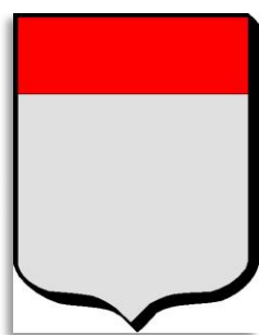
Wapenschild Alain IV de Penthievre, Earl of Cornwall & Richmond