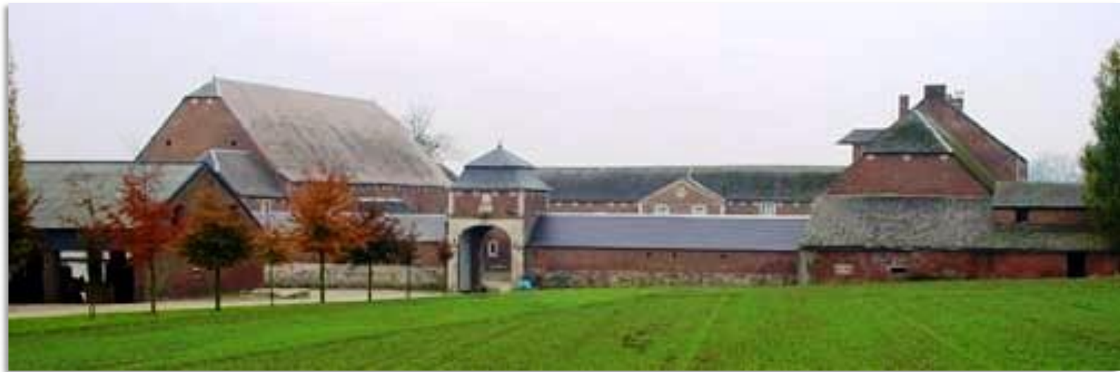
Gezicht op Ferme (versterkte boerderij) de Stocquoy te Jodoigne