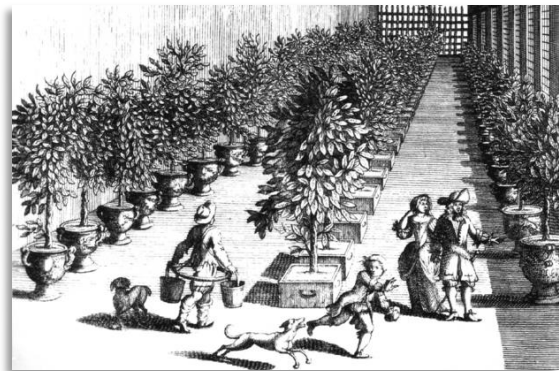
Kruidtuin anno 17e eeuw