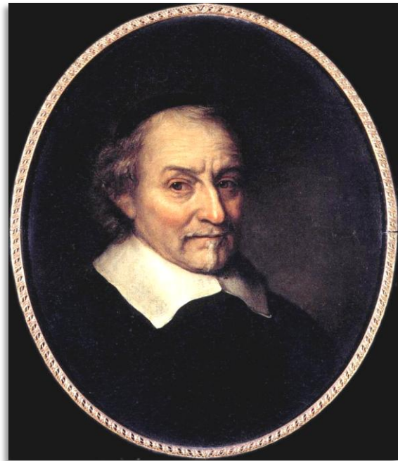
Joost van den Vondel (1587-1679), portret door Philip de Koninck 1665