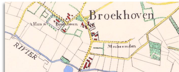
Huis te Broekhoven op kaart Van Zijnen 1760