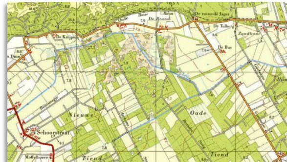
Udenhout omgeving natuurgebied Brandt anno 1969