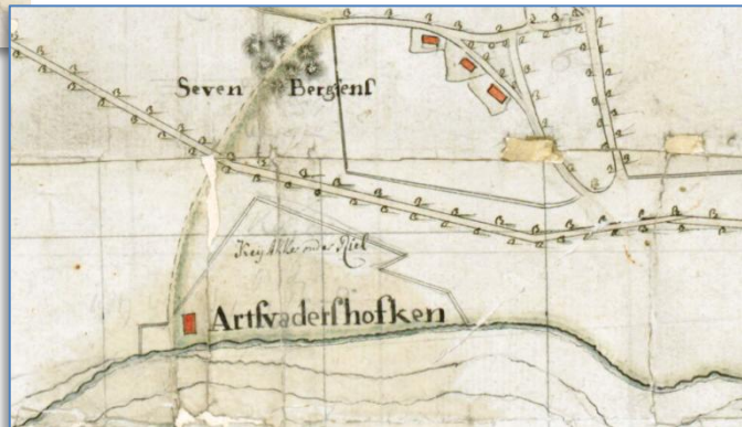
Uitsneden uit Caarte Figuratieve van de Heerlijkheden Tilburg, Goirle en Riel, 1890