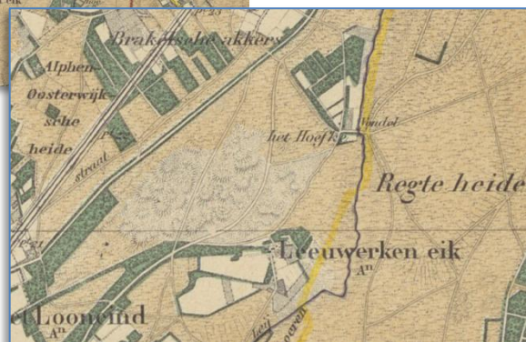
't Rielse Hoefke op manoeuvreerkaart leger 1883