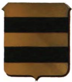
Het oude wapen van de heren van Diest (en Zelem)