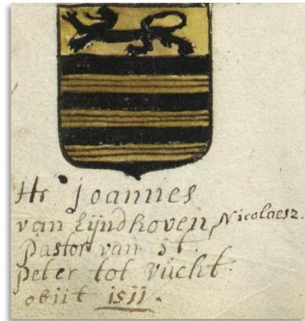
Wapenboek OLV Broederschap Den Bosch