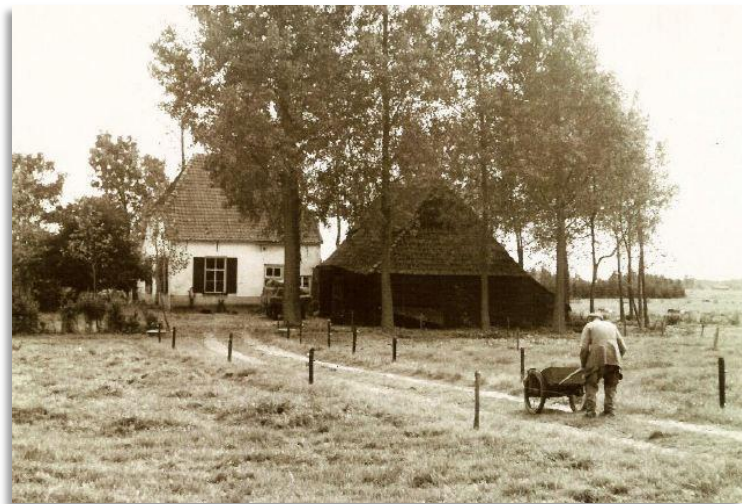
Huis Swanenborgh te Esch