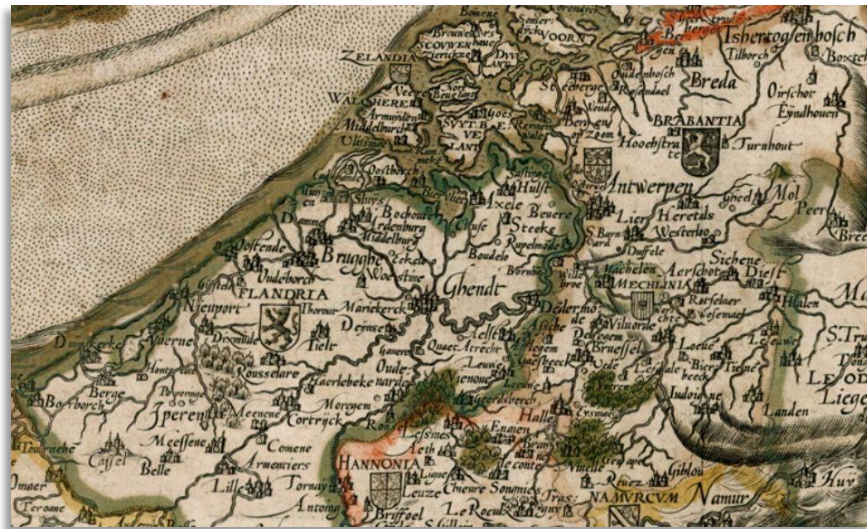
Uitsnede Graafschap Vlaanderen uit kaart Leo Belgicus anno 1559