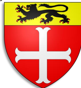
Wapenschild gemeente Aalter

Ook bestond er in Waarschoot bij Aalter een ‘Goed ter Beke’, thans genaamd ‘Hof Wenemaer’. Eén der oudste landbouwuitbatingen van de streek opklimmend tot de 13 e eeuw. In 1317 gekend als ‘Goed ten Walle’ en verkocht aan Willem Wenemaer, Gentse poorter en stichter van het zogenaamde ‘Wenemaershospitaal’ aan het Sint-Veerleplein; sinds 1327 in het bezit van het hospitaal. Typische site met walgracht met mottestructuur en 8-vormige omgrachting, confer oude kaarten en 16 e eeuwse