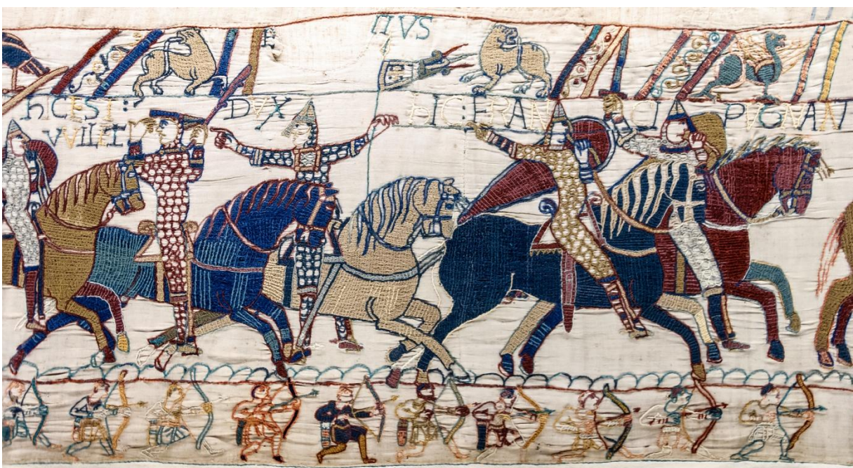
Slag bij Hastings in 1066, wandtapijt van Bayeux