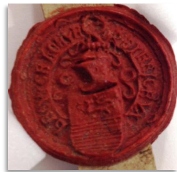
Zegel Dirck van Brouchoven als schout van Lisse, 1536

In het hertogelijk cijnsboek Oisterwijk over het jaar 1448/1449 vinden we over Godefridus nog de volgende interessante inschrijving: 19 (195). dominus johannes filius henricus bac pro liberis naturalis henricus bac filius naturalis bacconis ex parte relictam et liberis godefridi filii engule goeden de bono in tilborch prpe ecclesiam quondam engule goeden 2 s. nov. *145* (196). idem pro eisdem vanden ven in tilborch 2 s. nov.