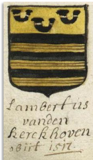
Wapenboek OLV Den Bosch