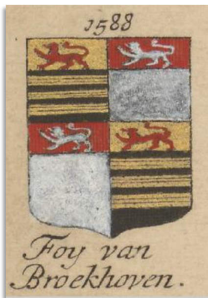
Wapenboek Hooogheemraadschap Rijnland