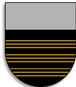
Wapen van Kempenland

Het oudst bekende voorbeeld van een wapenschild met de drielingbalken is te vinden op een zegel van Arnoldus van Beke, schout van Den Bosch die op 8 juni 1266 een oorkonde betreffende Sterksel zegelt. 6 Als wapen van het Kwartier van Kempenland staat het wapen eerst vast als hofhistoricus Gramaye er in 1610 over schrijft in zijn " Antiquitates Belgicae ". Het wapen van het Kwartier van Kempenland bestaat uit een zwart schild met drie drielingbalken van goud en een zilveren schildhoofd. Hoogstwaarschijnlijk werden de drielingbalken gebruikt als ambtswapen van functionarissen zoals bijvoorbeeld de Schout en zijn ze later overgenomen door de families van betrokken personen en min of meer verworpen tot geslachtswapen. In de kern kunnen we mijns inziens spreken van een typisch streekwapen voor het gebied Kempenland. Als we kijken naar het verspreidingsgebied van wapens met de drielingbalken, valt op dat dit het ruimere gebied van het oude Campinia is. Waar voorheen Hilvarenbeek gerekend werd tot het ruimere Campinia, wordt Hilvarenbeek vanaf ca 1350 gerekend tot het Kwartier van Oisterwijk.