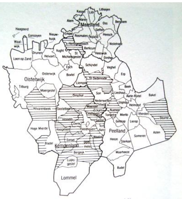
Verspreidingsgebied van wapens met de drielingbalken

H.L. van Broekhoven Schiedam, 8 november 2013