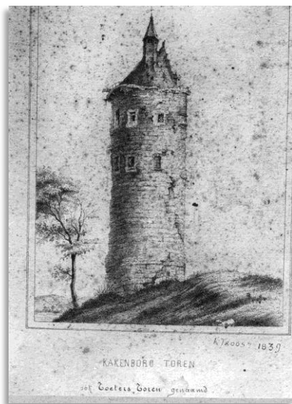
De Toetertoren Kakenborch te Diest