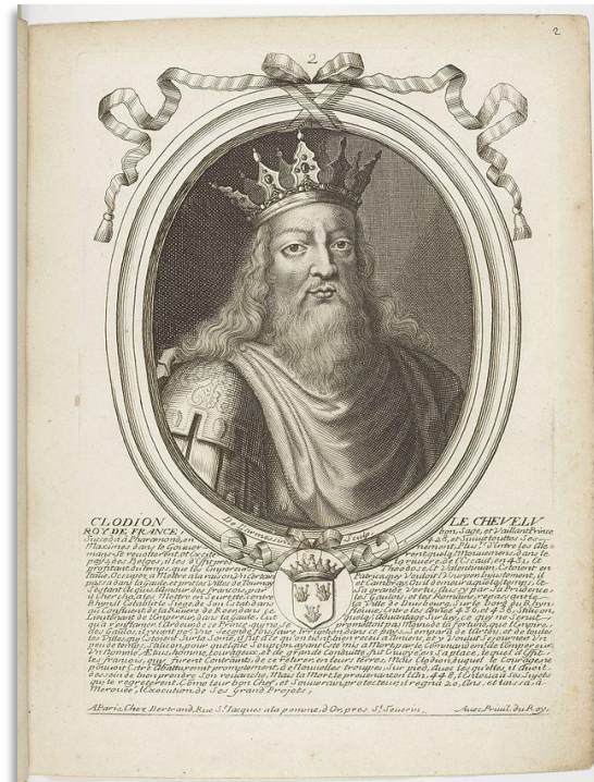
Koning Chlodio (ca 395-448)

De familie Van Landen (van waaruit Karel de Grote sproot), stichtte in de omgeving van het Belgische stadje Landen twee zogeheten motte-burchten ('Tombe van Pepijn' en 'Hunsberg'). Door huwelijk komt deze familie tevens in het bezit van de heerlijkheid Tilburg (met de motte-burcht Ter Borch in Oisterwijk). Met de stadstichting van Oisterwijk (1212) en de overname van Ter Borch start evenals in Landen ook daar de degradatie van de heren. Ze pasten kennelijk niet meer, of onvoldoende, in de hertogelijke machtspolitiek. De dynastie van de Merovingen (voorlopers van de Karolingen) huisde vanouds op de Kakenborch te Diest. In Huis Cupenborch te Den Bosch zouden eeuwen later de twee families elkaar weer kruisen.