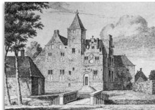
Norbertinessenklooster St. Catharinadal