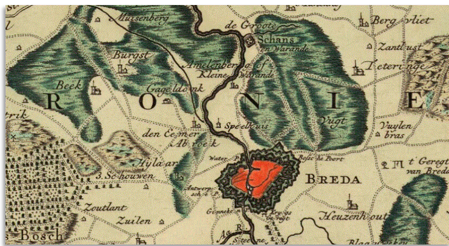
Detail van Kaart van een deel van Holland, Zeeland en Staats-Brabant, I. Condet 1748 met de landgoederen Gageidonck en de Emelberg (Kleine Warande).

aanwijzingen. Met de recente ontsluiting van een groot aantal vestbrieven door het archief Breda kwam echter aan deze onzekerheid een einde. Via verwantschap met het geslacht De Bye, lijken de Broechevens gelieerd te zijn aan Wassenaar / Polanen / Duvenvoorde / Assendelft. Adellijke geslachten die ook in Hollandse steden als Leiden en Haarlem hun stempel drukten. Bovendien wierpen de vestbrieven uit Breda tevens nieuw licht op de afstamming van Pieter van Son, die een gemuteerd wapen Van Brouchoven met kleuromkering voerde. En als klap op de vuurpijl bleken de Leidse Van Brouchevens via De Bye ook verwant te zijn met een bastaardtak Van Nassouw/Nassau. De puzzel lijkt nu bijna compleet.