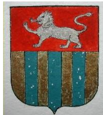
Wapen VAN TILBURG