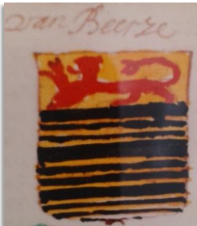
Wapenboek De Lange (CBG, Den Haag)