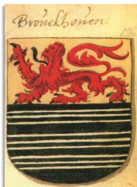
Wapenboek Willem Jacobsz, 1565

Het wapen Van Brouchoven in het eerste en vierde kwartier van het wapen van de gelijknamige familie uit Leiden, toont drie gouden drielingbalken op zwart. Deze drielingbalken zijn van oorsprong oud-Kempisch en komen vrij regelmatig voor in de wapens van o.a. Van Doerne, Teulings, Van Thulden, Van Hezeacker, Van Beerze, Van den Bosch, Van den Dijk, Van Son etc. Maar waar komen ze nu precies vandaan? Een relaas van een zoektocht langs eeuwenoude landgoederen rond Tilburg en Hilvarenbeek, van beekjes, stroompjes en riviertjes, van bruggen, kruisingen en van ridders en abdijen.