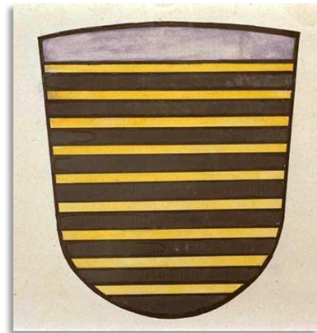
Wapen van kwartier Kempenland

Dat niemand de wijsheid in pacht heeft blijkt wel weer uit de wapens van het kwartier Kempenland die ik onlangs aantrof. De dwarsbalken zijn (nog) niet gegroepeerd in drielingsbalken, maar het wapen heeft ongetwijfeld als inspiratie gediend. Het Kwartier van Kempenland was één der vier kwartieren van de Meierij van 's-Hertogenbosch dat de volgende plaatsen omvatte: Lommel, Dommelen, Borkel en Schaff, Valkenswaard, Aalst, Stratum, Eindhoven, Eckart, Woensel, Best, Oirschot, Middelbeers, Oostelbeers, Vessem, Casteren, Netersel, Bladel, Reusel, Bergeijk, Gestel, Blaarthem, Meerveldhoven, Zeelst, Veldhoven, Oerle, Wintelre, Hoogeloon, Hapert, Eersel, Duizel, Knegsel, Steensel, Riethoven, Westerhoven. De indeling in kwartieren werd ingesteld toen de Hertog van