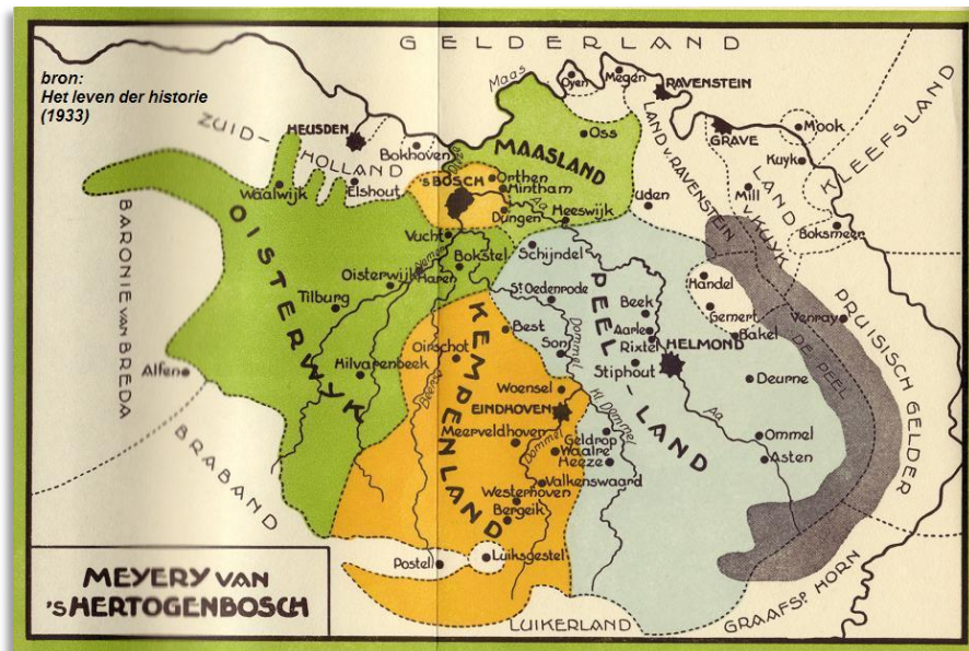
De 4 kwartieren in de Meierij van Den Bosch

H.L. van Broekhoven Schiedam, 13 september 2013