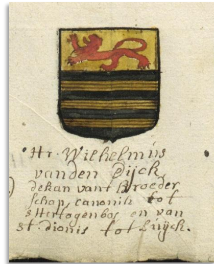
Wapenboek OLV broederschap D. Bosch