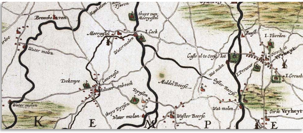
Uitsnede uit Kaart Brabantia, Frederick de Wit, 1680

Ik huldig namelijk de stelling dat naar alle waarschijnlijkheid de drielingbalken in den beginne, en dan praten we over ca 1150 toen een deel van Texandrie werd hernoemd in Campinia, zijn ontstaan. Vermoedelijk heeft het wapen met de drielingbalken eerder toebehoord aan de graven van Campinia Brabantica. Later is het oorspronkelijke ambtswapen van de Schout uitgegroeid tot het streekwapen van Kempenland en overgenomen in de geslachtswapens van hertogelijke functionarissen. De Latijnse term Campinia staat voor 'woeste grond'. In de begintijd werden de vruchtbare delen van deze woeste grond ontgonnen en in cultuur gebracht. En waar was de aarde het meest vruchtbaar? Juist, aan de oevers van beken en rivieren, waar het stromend water de levensaders vormden in de schrale gronden. De drie drielingbalken staan volgens mij aldus symbool voor de rivieren die, als we naar de waterlopes in Oost-Brabant kijken, vaak gedrie hun weg door het land banen. De Reusel, De Beerze en de Dommel als onmisbare levenslijnen voor succesvolle ontginning van het barre land.